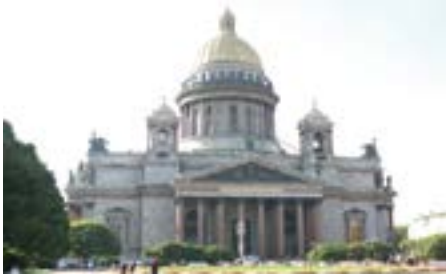
Sankt Petersburg

Kunst Westeuropas im Mittelpunkt. Am Nachmittag haben Sie Zeit, das Museum auf eigene Faust weiter zu erkunden oder beispielsweise zu einem Einkaufsbummel in Eigenregie auf dem Nevskij Prospekt aufzubrechen. (F, A)