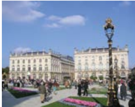
Nancy, Place Stanislas · Moala

Die Tagesreise führt Sie nach Nancy, der majestätischen alten Hauptstadt Lothringens. Die glanzvollen Rokokoanlagen der von vergoldeten Toren umgebenen Plätze, der mit kunstvollen Blumenarrangements geschmückte Pepinière-Park sowie die malerische Altstadt sind immer wieder faszinierend. Bei einem Stadtrundgang erkunden Sie Altstadt, Park und Rokokoensembles des Herzogs Stanislas. Die Mittagszeit und ein Teil des Nachmittags gehören dem Jugendstil: In einem der schönsten Jugendstilrestaurants Frankreichs wird für Sie ein 3-Gang-Menü serviert. Im Anschluss besuchen Sie das Jugendstilmuseum mit seinem herrlichen Garten, der mit Pflanzen angelegt wurde, welche die Jugendstilkünstler zu ihren Motiven inspirierte. In dem Museum sind Räume mit schönsten Möbeln und Kunsthandwerk dieser Epoche ausgestattet. Zum Abschluss der Fahrt besuchen Sie ei-