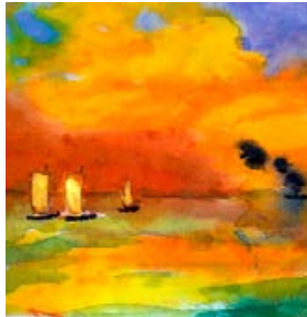
Südsee · Emil Nolde

Veranstalter: Wilcken Kulturreisen, Saarbr. Preis: 59 Euro inkl. Eintritte, Führungen, Reiseleitung und Busfahrt