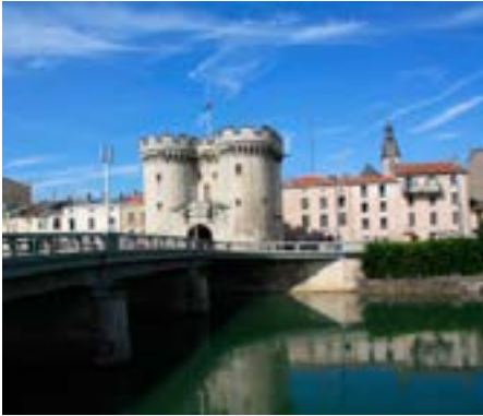
Verdun • Stibat Studio, Fotolia.com

Ausstellung gezeigt, die die „Schätze der Maas“ vereint, darunter herrliche Marien- und Heiligenfiguren, Kunsthandwerk und Goldschmiedearbeiten. Aus über 38 Kirchen des Maasgebiets zusammengetragen, geben sie bis Anfang November in St. Mihiel einen Gastauftritt, bis sie dann in ihre Gotteshäuser wieder zurückkehren. Selbst aus Paris ist eine in Lothringen gefertigte Madonna zu Gast! Die Ausstellung ist im ehemaligen Abteipalast untergebracht, wo Sie auch einen der schönsten Bibliotheksräume im Osten Frankreichs bewundern können.