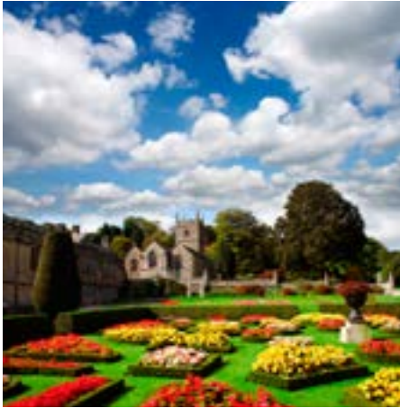
Herrliche Palastgärten

den Wisley unser Ziel. Die königlichen Gartenanlagen von Wisley, des größten der englischen RHS Gärten, bietet eine beeindruckende Gartenwelt: der Steingarten mit der Sammlung japanischer Ahorne, die 80m lange Doppelborder, das Gewächshaus am See sind nur einige Punkte dieser 40ha großen Parkanlage. Piet Oudolf legte hier Staudenpflanzungen an und Penelope Hobhouse gestaltete den Rosengarten. Der Shop und die Gärtnerei von Wisley verführen jeden Gartenfreund zum Einkauf.