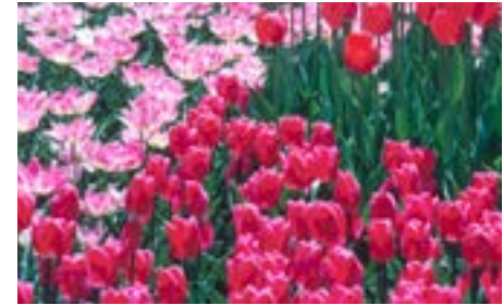
Impressionen · Imagelibrary, Ingram

Erstes Ziel der Reise ins malerische Tal der Maas ist der private Garten „Le Sous-Bois“, der erst seit kurzem für die Öffentlichkeit zugänglich ist und von dem sich herrliche Blicke auf das Maastal öffnen. Weiter geht es zu einem der größten Wassergärten Europas, dem Park von Annevoie. Wasserbassins, Fontänen und Wasserfälle sind in einem wunderschönen Park eingebettet, ein ständiges Schauspiel fließenden und sprudelnden Wassers kennzeichnet die Parkgestaltung. Das Schloss von Annevoie bildet die prächtige Kulisse für die Gartenlandschaft. In Annevoie besteht die Möglichkeit zu einem Mittagessen.