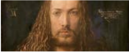
Albrecht Dürer · Selbstbildnis

aus dem Paul Getty Museum in Los Angeles, der National Gallery in London und dem Kunsthistorischen Museum in Wien nach Frankfurt a.M. Als besonderer Höhepunkt wird der Heller-Altar wieder vereint präsentiert, dessen einzelne Tafeln heute in verschiedenen Museen verwahrt werden. Nach dem Ausstellungsbesuch erkunden Sie im Rahmen einer Führung das historische Zentrum Frankfurts mit dem Römer, der Paulskirche und dem Domberg kennen oder Sie können die Zeit individuell gestalten.