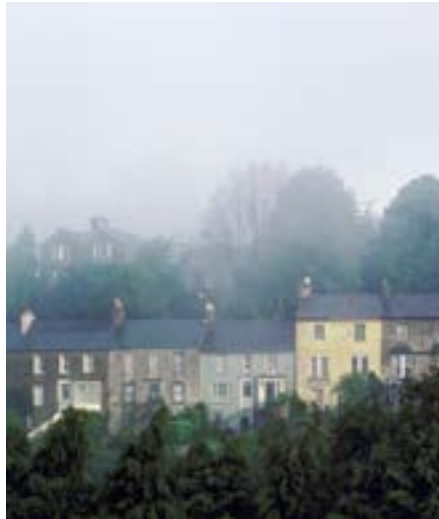
Dorfansicht · Imagelibrary

Veranstalter: Wilken Kulturreisen, Saarbr. Preis: 95 Euro inkl. 3-Gang-Menü mit Getränken, Führung Ribeauvillé, Reiseleitung, Busfahrt