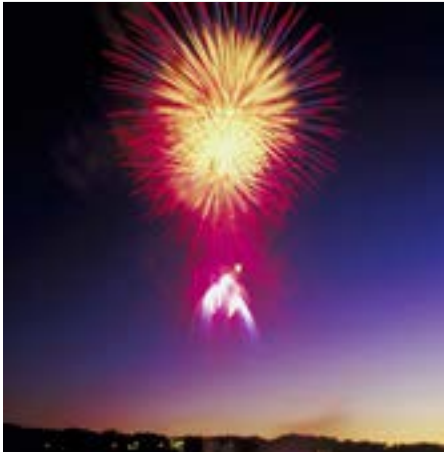
Firework over the city

■ 31.12.2013: Heute starten wir zu einer Stadterkundung wichtiger Sehenswürdigkeiten von Tower Bridge und Tower bis hin zu „More London!“ und Bankside. Wir sehen auch Buckingham Palace, Royal Albert Hall und Albert Memorial. Am Nachmittag ist Zeit zum Shopping oder dem Besuch von Museen und Galerien. Am Abend kann man am Themseufer, Trafalgar Square oder im St. James' Park mit dem Feuerwerk an und auf der Themse das Neue Jahr 2014 begrüßen.