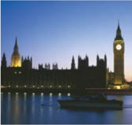
London · Imagelibrary, Ingram

Unsere Schülerinnen und Schüler wohnen bei ausgesuchten englischen Gastfamilien. Dadurch kommen Sie in Kontakt mit den unterschiedlichsten Akzenten, was eine wesentliche Hilfe beim Bewältigen der Prüfung des Hörverstehens im ersten Teil des schriftlichen Abiturs darstellt. Mit diesem Kursangebot setzt die Kreisvolkshochschule eine sehr erfolgreiche Zusammenarbeit mit der Sprachschule fort, die aus dem Zusammenschluss mit Angloschool hervorgegangen ist. Inhaltlich und organisatorisch wird das Kurspro-