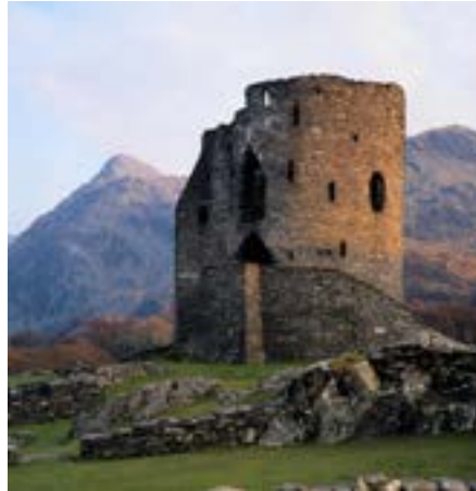
Herrliche Landschaften · Imagelibrary

Fahrt mit einem modernen Reisebus · Fahrt mit dem Euroshuttle Calais-Folkstone und Folkstone-Calais · 8x Übernachtung mit engl. Frühstücksbuffet · 8x Abendessen im Rahmen der Halbpension · Reiseleitung während der gesamten Reise · Im Reisepreis sind keine Eintrittsgelder sowie Kosten für lokale Führer bei Besichtigungen enthalten ·