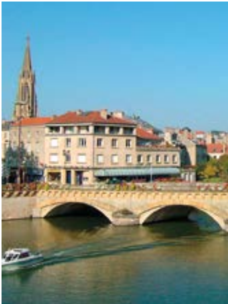
Metz - Sebcaen

Anders als bei den Wiener Philharmonikern wird im eindrucksvollen Konzertsaal des Arsenal von Metz ein Neujahrskonzert be-