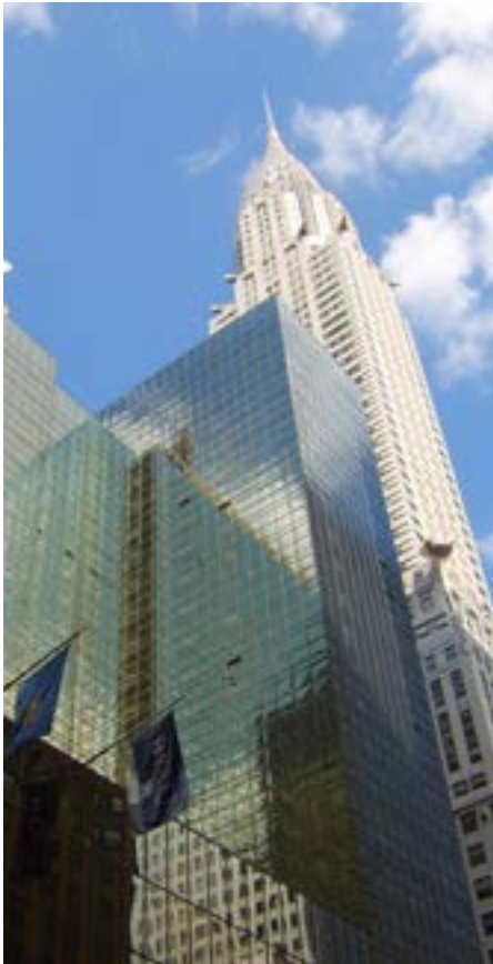
Chrysler Building